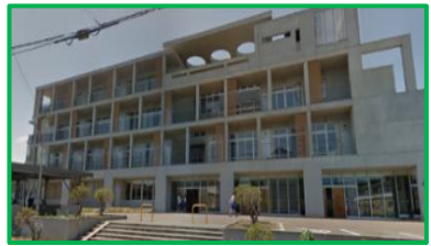
宮内中学校 1.7km(徒歩24分)