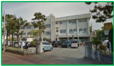
上組小学校 600m(徒歩8分)