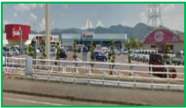
宮内ショッピングセンター 1.7km(車4分)